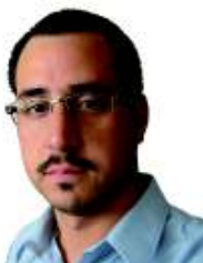
POR DIÓGENES PASTORI