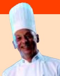
POR MARCELO MEGNA