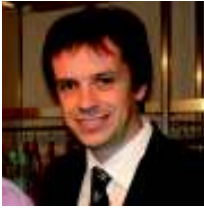
POR GUSTAVO YANCZEWSKI