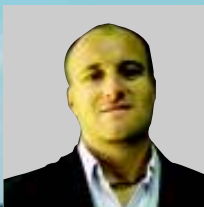
POR LALO FALCIONI