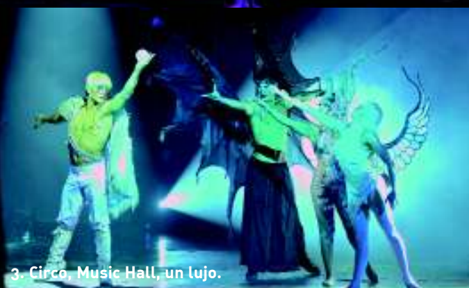
3. Circo, Music Hall, un lujo.