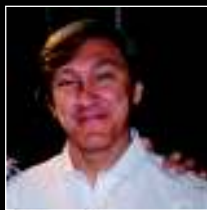
POR ORLANDO VERNA