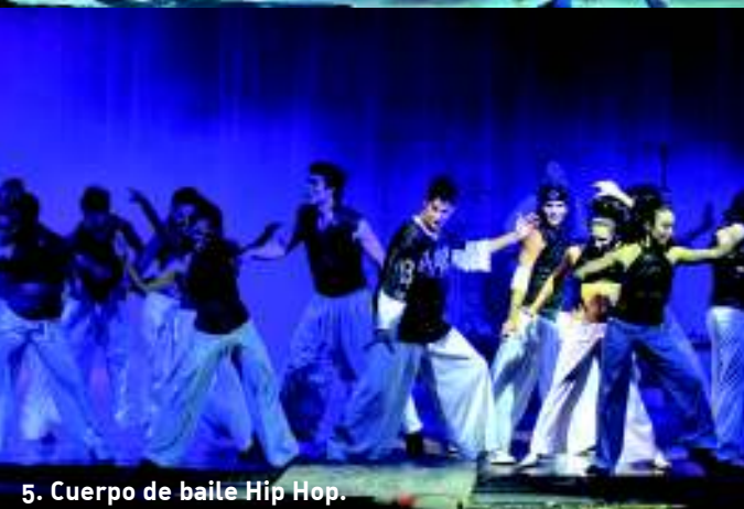
5. Cuerpo de baile Hip Hop.