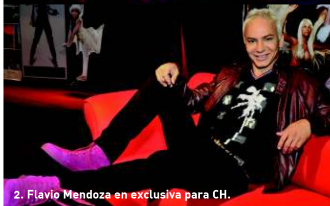
2. Flavio Mendoza en exclusiva para CH.