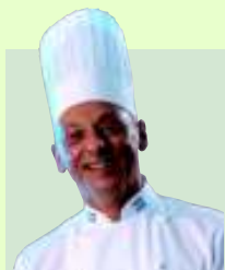
POR MARCELO MEGNA