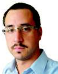
POR DIÓGENES PASTORI