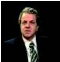
POR MAURICIO MARONNA