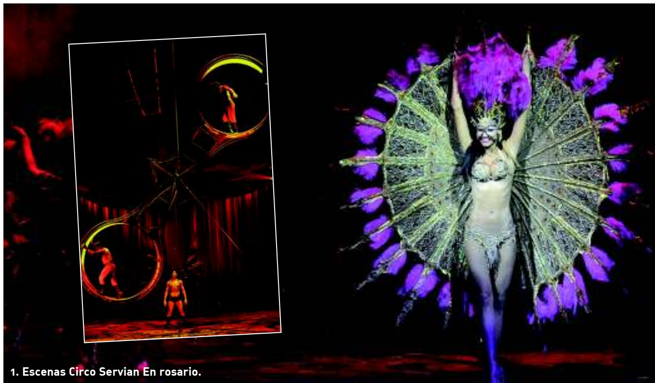
1. Escenas Circo Servian En rosario.