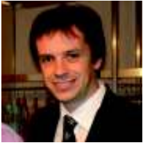
POR GUSTAVO YANCZEWSKI