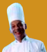
POR MARCELO MEGNA