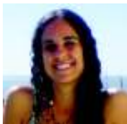
POR NOELIA SCIARRATTA