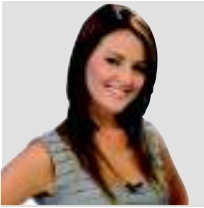
POR ROMINA BATALLÉS