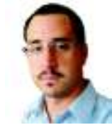
POR DIÓGENES PASTORI