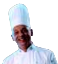
POR MARCELO MEGNA