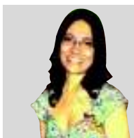
POR BEATRIZ PRIOTTI

¿EN QUÉ PENSAMOS CUANDO ESCUCHAMOS LA PALABRA NAVIDAD? ¿EN LAS COMPRAS ALOCADAS? ¿EN LAS TRADICIONES FAMILIARES? ¿EN LA CONMEMORACIÓN DEL NACIMIENTO DE JESÚS? ¿EN EL MENÚ DEL 24? ¿O EN UNA COMBINACIÓN DE TODAS ESTAS RESPUESTAS? LOS TIEMPOS ACTUALES NOS CONDUCEN A RECORDAR EL NATALICIO A TRAVÉS DE ALGUNAS IMÁGENES EVOCATIVAS PERO A VIVIRLO DE LA MANERA MÁS COMERCIAL.