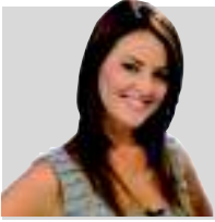
POR ROMINA BATALLÉS