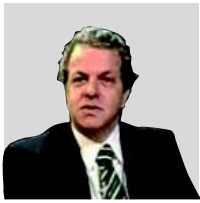
POR MAURICIO MARONNA