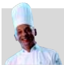
POR MARCELO MEGNA